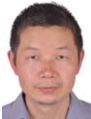
张健(1969—),男,安徽庐江人,博士,研究员,博士生导师,CCF 杰出会员,主要研究领域为自动推理与约束求解,软件测试及分析.