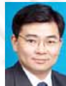
明仲(1967 - ),男,博士,教授,博士生导师,CCF 高级会员,主要研究领域为软件工程,云计算,中间件技术.