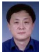
吴建平(1953—),男,博士,教授,博士生导师,CCF高级会员,主要研究领域为计算机网络体系结构,网络协议测试.