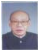
唐稚松(1925 - ),男,研究员,博士生导师,中国科学院院士,主要研究领域为时序逻辑,程序验证,数理逻辑,自动机理论及软件工程。