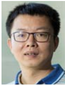
崔斌(1975—),男,浙江宁波人,博士,教授,博士生导师,CCF 杰出会员,主要研究领域为数据库系统,大数据管理和分析.