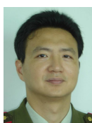
肖依(1969-),男,博士,教授,博士生导师,CCF 高级会员,主要研究领域为分布计算,网格计算.