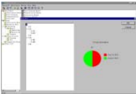
Fig.2 The graphical interface of the decision tree and the background: the GUI of the system 图 2 分类操作树型结果的图形界面以及类 Explorer 风格的主图形界面